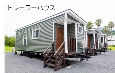
トレーラーハウス