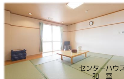
センターハウス 和室