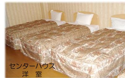
センターハウス 洋室