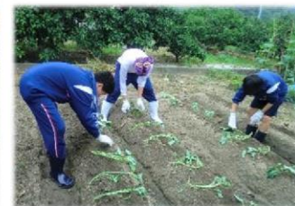
さつまいもの苗付け